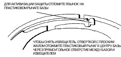
Рис.2. Защита от несанкционированного извлечения извещателя